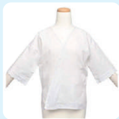
肌襦袢 (半袖 Tシャツ可)