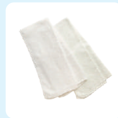
フェイスタオル 3枚